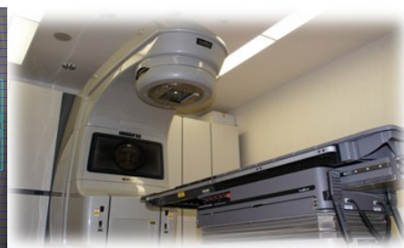
放射線治療装置 CL-21EXs バリアン社製