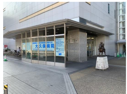
大久保病院 正面玄関